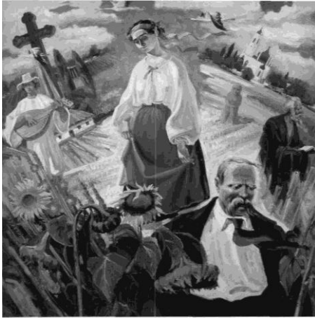
“Думи мої думи...” 2000

тьох громадських комісій, учасник різноманітних культурно-мистецьких заходів, професор Черкаського національного університету імені Б. Хмельницького. А найголовніше – митець продовжує творити.