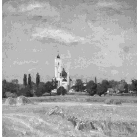
“Жнива у Мошнах” 1994